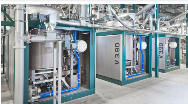
Die BURKHARDT-Holzvergaser des Typs V3.90

Als einer der deutschlandweit führenden Hersteller, Betreiber und 360°-Dienstleister für Energie-, Gebäude-, Heizungs-, Klima- und Lüftungstechnik sowie für Sanitär-, Spengler- und Installateurarbeiten greift die BURKHARDT GmbH auf über 40 Jahre Erfahrung zurück. Aktuell betreuen rund 450 Mitarbeiter*innen Projekte weltweit. ■