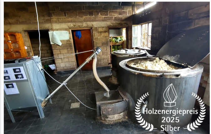
Typische Schulküche in Kampala, Uganda, im Juli 2025 – die Belastung der Köche durch Rauchgase führt regelmäßig zu schweren Gesundheitsproblemen. Mit Pelletbrenner nachgerüsteter Kochherd in Kigali, Ruanda, mit einem Fassungsvermögen von 500 Litern