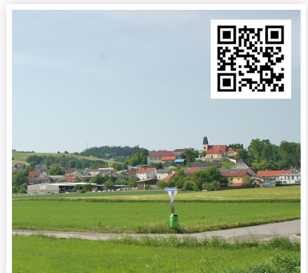
2021 erfolgte der Entschluss des Bürgermeisters, die Gemeinde auf erneuerbare Energien auszurichten.