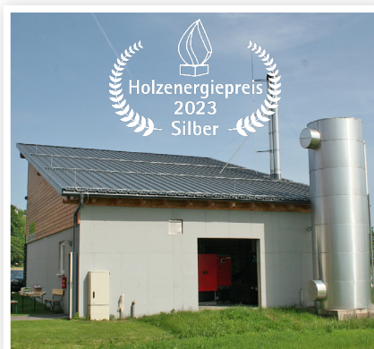
Drei weitere Kessel werden dazugestellt, um die Nachfrage bedienen zu können.