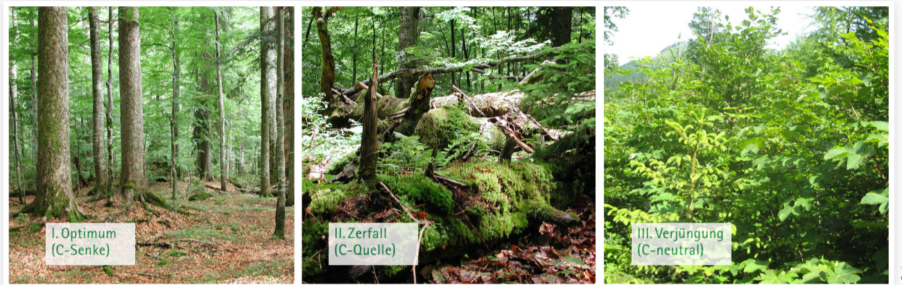
Abb. 1: Stadien der Waldentwicklung im Urwald und ihre Wirkung auf den Kohlenstoffkreislauf – durch die Ernte der Bäume vor Erreichen der Zerfallsphase wird der Wirtschaftswald künstlich in seinem Optimum gehalten.

Mit einer Tonne Kohlenstoff, die in Form von Holz aus dem Wald entnommen wird, können alleine durch die energetische Verwertung 2,7 Tonnen fossile CO 2 -Emissionen eingespart werden (Annahme Buchenbrennholz lufttrocken als Ersatz von Heizöl). Abb. 2 berücksichtigt die Substitutionseffekte durch die energetische Verwertung im Vergleich zum Urwald.