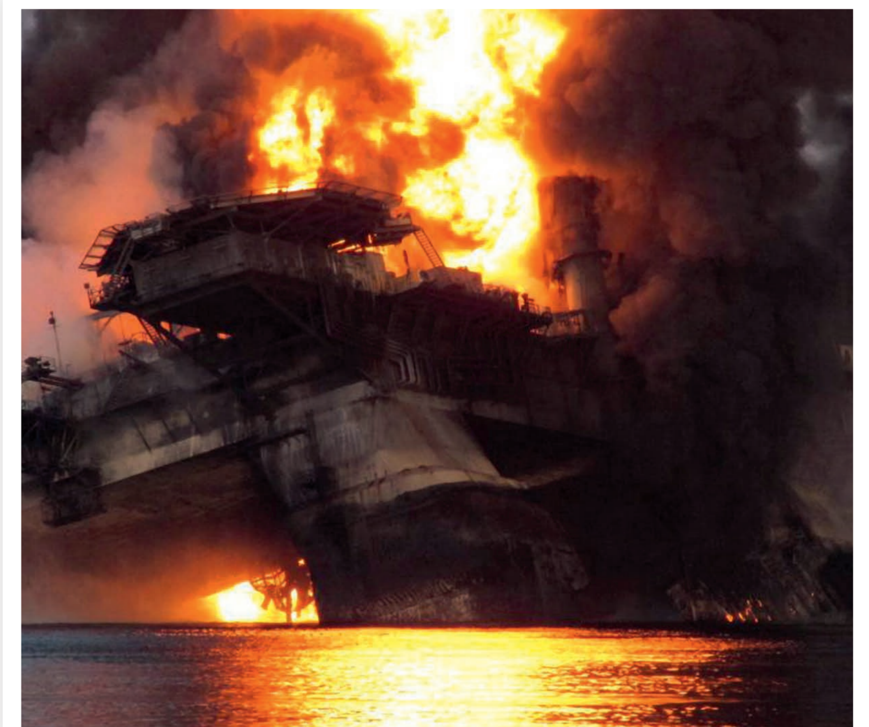
Explosion auf der Bohrrinsel „Deepwater Horizon“ im Golf von Mexiko im April 2010