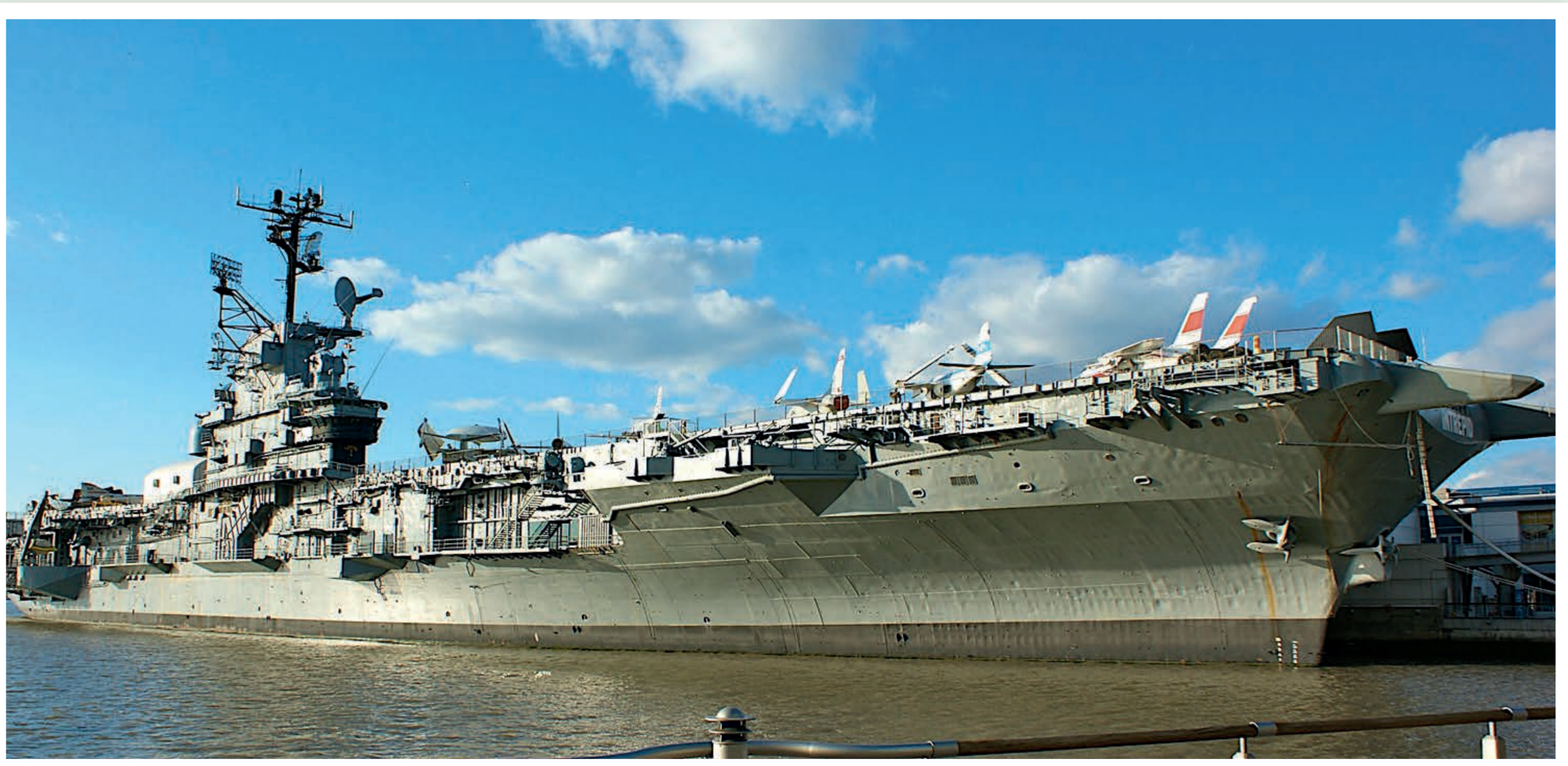
Kriege wurden in jüngster Vergangenheit häufig um fossile Ressourcen geführt; die hohen Kosten der militärischen Sicherung von Erdölvorkommen und -transporten spiegeln sich nicht in den Energiepreisen wider.