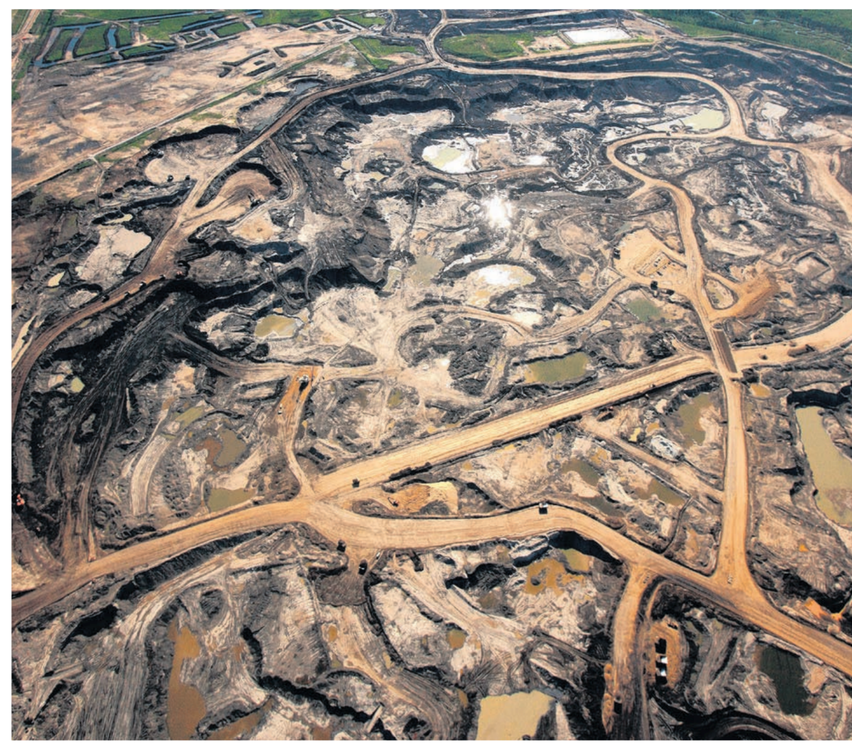
Beim Ölsandabbau, wie hier in Kanada, werden Unmengen Energie verschwendet und Landschaften verwüstet.

Durch die Straße von Hormus im Persischen Golf wird rund ein Drittel des auf dem Seeweg transportierten Erdöls befördert. Eine angesichts der Spannungen zwischen den USA und dem Iran seit Sommer 2019 drohende Sperrung dieser Meerenge würde den Ölpreis in die Höhe treiben – mit schwerwiegenden Folgen für die gesamte Weltwirtschaft.