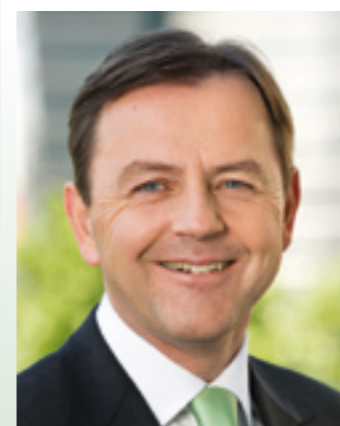
DI Niki Berlakovich, Landwirtschafts- und Umweltminister

Wer zusätzlich sparen möchte, lagert den Brennstoff im Frühjahr oder Sommer ein. In dieser Zeit werden von Brennstoffhändlern Einlagerungsaktionen zu attraktiven Preisen angeboten.